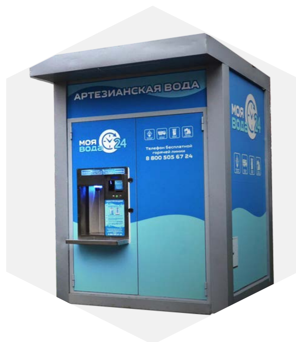
СЕТЬ АВТОМАТОВ ЧИСТОЙ ВОДЫ